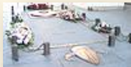
г. Париж, Франция