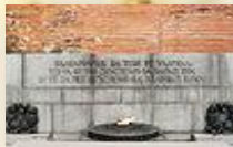
г. София, Болгария

благодарность и уважение всем погибшим солдатам, чьи останки так и не были идентифицированы.