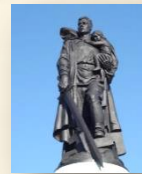
г. Берлин, Германия