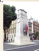
г. Лондон, Англия