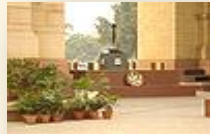
г. Нью-Дели, Индия