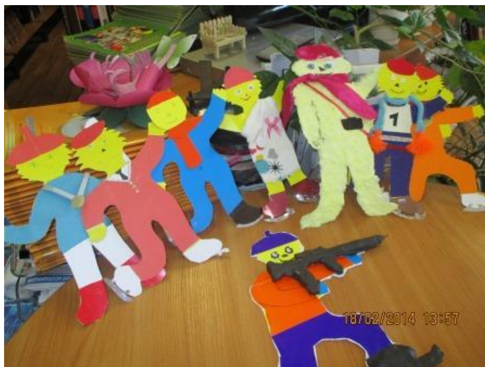
Олимпийская команда «Мурзилки».